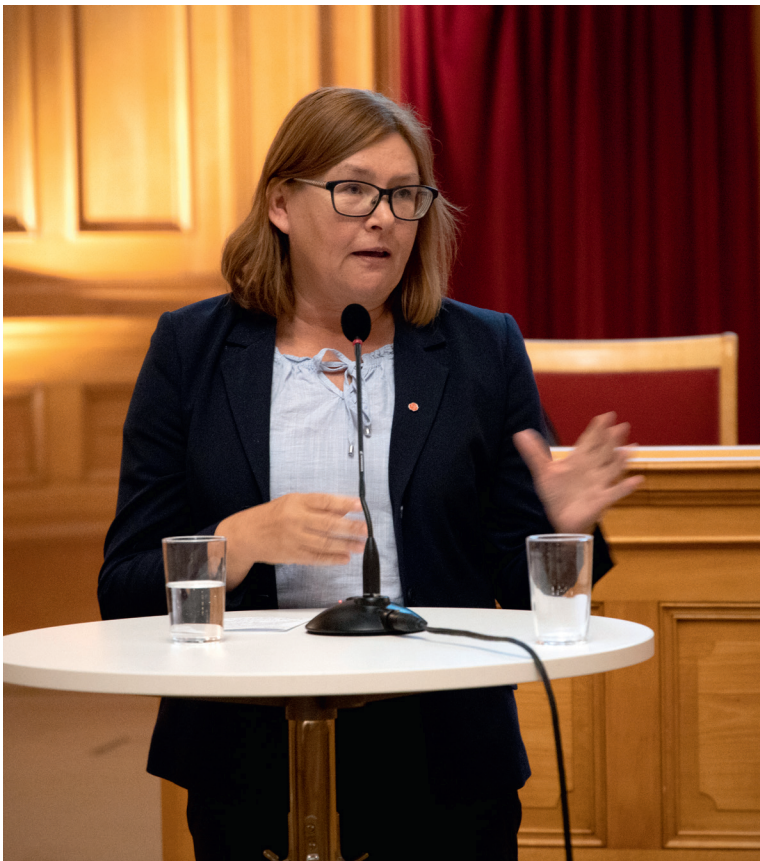
▲ Gunilla Svantorp, riksdagsledamot på Skolpolitiska dagen 22/11 2019.